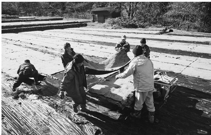
耕作放棄地を活用して栽培されたコケ。栽培用マットが1枚ずつ丁寧にはがされる。山形市高瀬地区